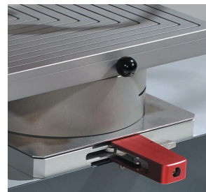
快拆界面(接头) 更换夹具只需几秒钟