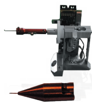
拉力传感器(模块) 可使用现有的勾针

三轴皆为高扭力设计,且开放式的工作台面设计,可容纳不管多宽或多小的待测物,可能只需要一点或完全不需使用特殊治具。高精度的快拆式夹具和测试模块,可以确保快速更换测试样品和立即进入测试。