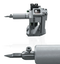
推力传感器(模块) 可使用现有的推刀